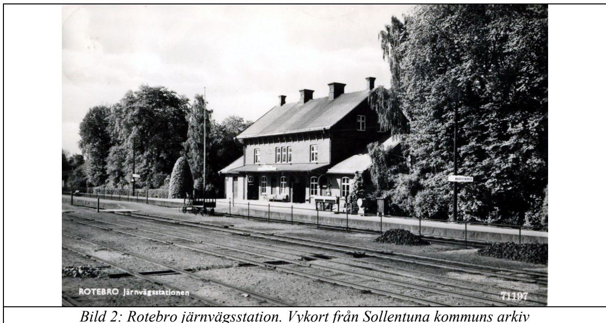
Bild 2: Rotebro järnvägsstation. Vykort från Sollentuna kommuns arkiv

Något fotografi från järnvägsstationen har jag inte funnit. Den blev heller inte så gammal eftersom den brann ner på 1870-talet. Ett nytt stationshus byggdes och det stod klart 1876. Där fick poststationen åter plats. Var den låg i mellantiden är oklart, men det ligger nära till hands att gissa att den återinfördes i gästgivargården som inte låg så långt ifrån järnvägsstationen.