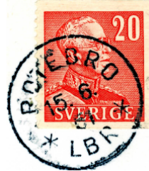
Nst 59c LBR