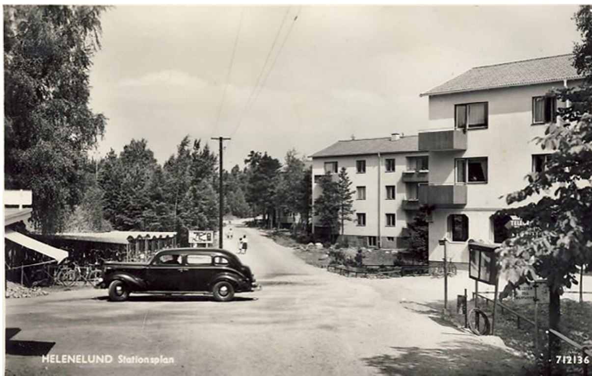
Posten på Stationsplan, Åkervägen 4, var en trevligt inredd post.

I södra Helenelund låg gårdarna Silverdal, Tegelhagen, Kasby, Margreteborg och Rådan vilka alla tillhörde till Spånga före 1949. Posten till dessa gårdar gick över Ulriksdal åtminstone fram till 1949. Att posten gick över Ulriksdal var naturligt eftersom det i Ulriksdal fanns en poststation redan 1866.